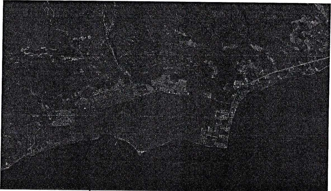
Figura 1: Área de Estudio

Para una mayor claridad de la delimitación del área de estudio, ésta se presenta en la siguiente figura: